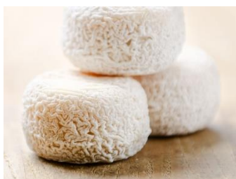
Crottin de chèvre affiné nature