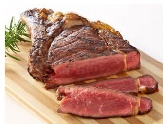
Entrecôte de boeuf