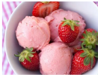
Glace au lait de vache à la fraise