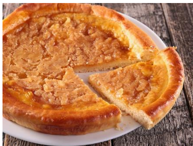
Tarte au sucre