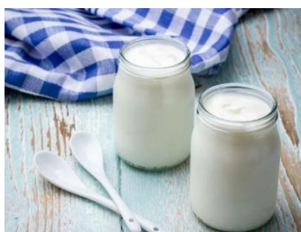
Yaourt entier nature au lait de vache