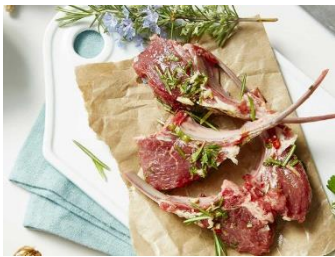
Basse côte marinée d'agneau